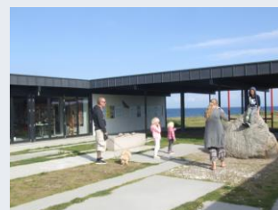
Sydstenen har stor interesse