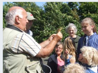
Fugl præsenteres af ornitolog