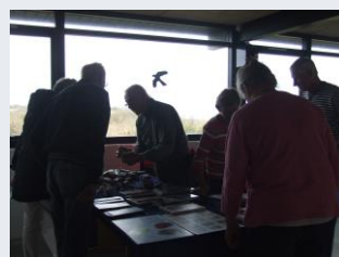
Stenvurdering og -bestemmelse