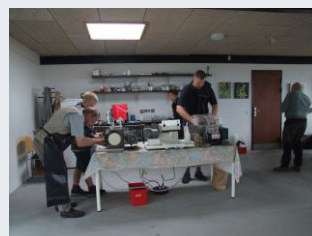
Stenskæring og polering