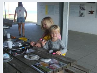
Store lærer små