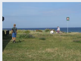
Gedser Odde mod kysten