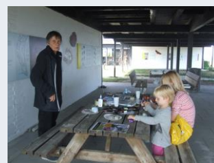
Tang og maling i picnicrummet