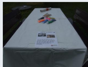
En opgave præsenteret