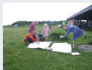
Insektvæddeløb på dug