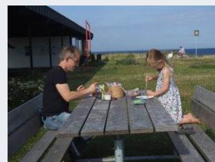
Aktiviteter mod vandet