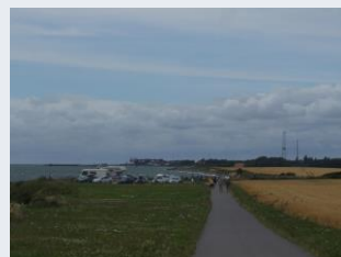
Gangsti fra P-pladsen