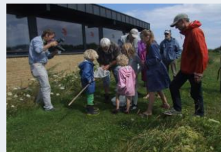
Ser på ildtæger