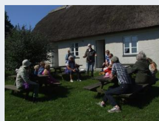
Besøg på Gedser Fuglestation