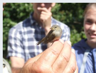
Fugl, der skal ringmærkes