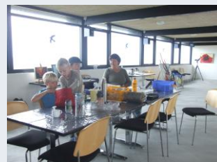
Maler på sten